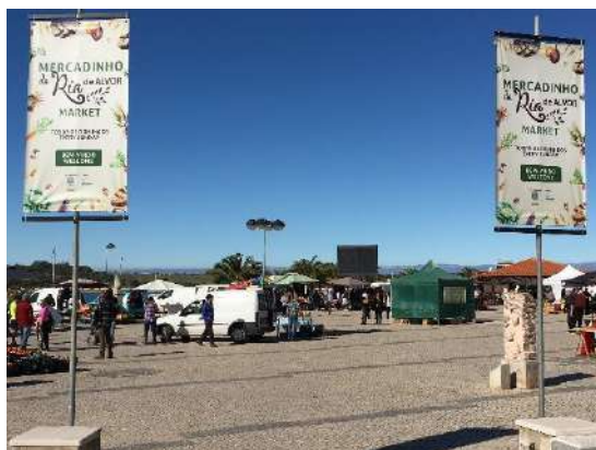
Tabela 19: Ocupação mensal do Mercadinho da Ria

Nota: Foram adquiridos 2 pendões bilingue para sinalizar a entrada norte do Mercadinho e publicitar o mesmo com o dia e horário de realização.