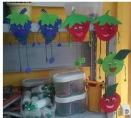
Dia da Alimentação. Construção de iman para o frigorífico.