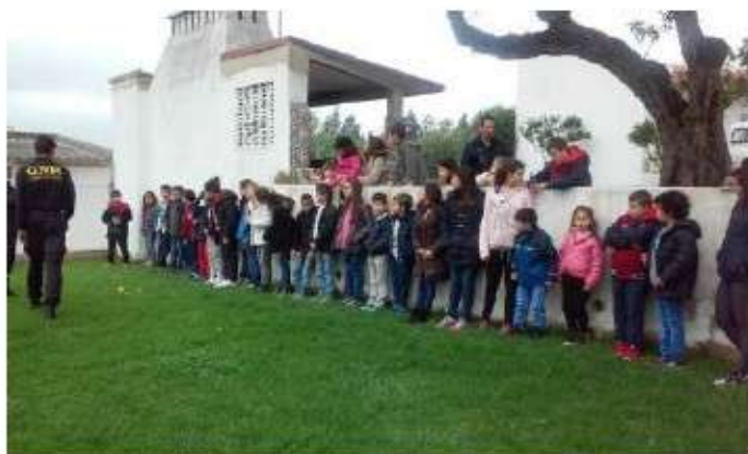
Carnaval- Visita à GNR Portimão

Nas INTERRUPÇÕES LETIVAS DO CARNAVAL E DA PÁSCOA a Ludoteca funcionou como previsto todo o dia, das 10.00h às 18.00h e na ÉPOCA BALNEAR das 9.00h às 17.00h. Para as famílias que necessitaram a equipa acompanhou as crianças ao Centro Comunitário para almoçar, sendo o serviço de refeitório da responsabilidade do Judo Clube de Alvor.