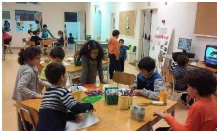
Instalações da Ludoteca no C. Comunitário de Alvor

Na INTERRUPTÃO LETIVA DO NATAL a Ludoteca esteve encerrada, para que se fizesse a mudança para as instalações do C. Comunitário. Os Encarregados de Educação haviam sido informados em reunião no início do ano em relação a esta mudança e a data em que iria acontecer.