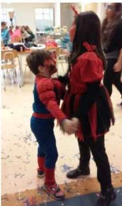
Carnaval - Máscaras em Musgami e baile de Carnaval.