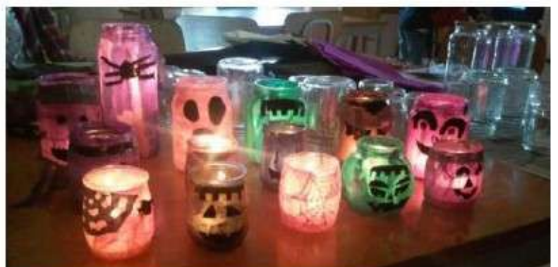
Halloween. Lanternas com velas, feitas a partir de frascos de vidro