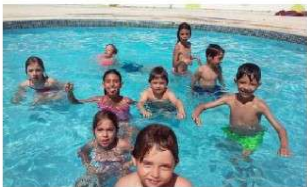
Época Balnear - Praia, piscina e passeios

Ao contrário do que se passou nos anos anteriores, durante a ÉPOCA BALNEAR o serviço da Ludoteca só funcionou mesmo para as crianças que foram admitidas para esta época - grupo constituído por inscrições sujeitas a critérios de prioridade para admissão. Não foi aberto o período da tarde para as restantes crianças por questões relacionadas ao espaço e constituição da equipa. Assim, trabalhou-se neste período com um grupo de 44 crianças.