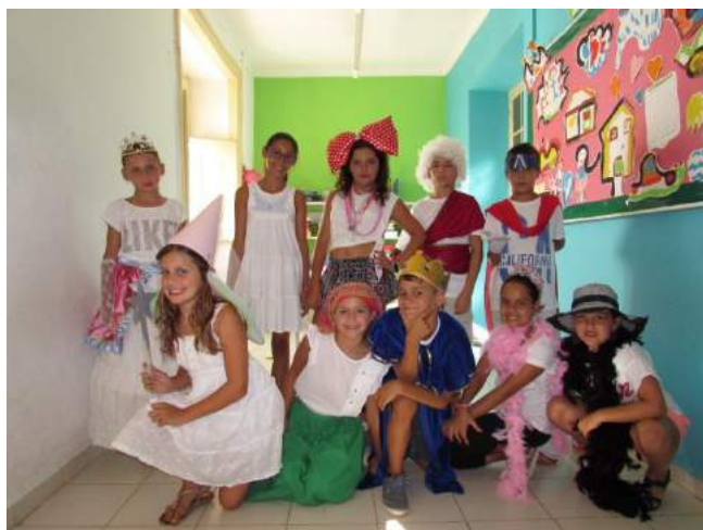
Fig 25 e 26 - Festa Branca 2015

O segundo momento de festejo foi no final da Época Balnear com a FESTA DE ENCERRAMENTO . Estiveram presentes 41 crianças da Ludoteca e 71 familiares, num total de 112 convidados. As crianças apresentaram um espetáculo com teatro, canções e danças ensaiadas durante a Época Balnear (tarde) e em seguida houve um jantar convívio com comida trazida pelas Famílias.