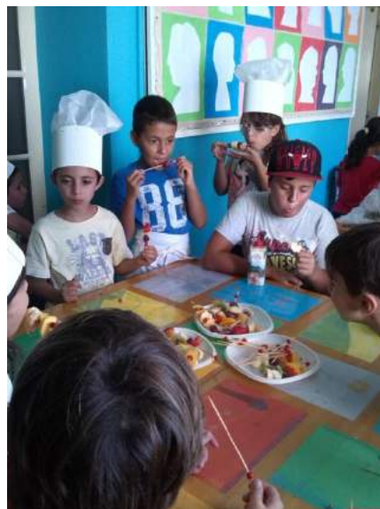
Fig 21 e 22- Dia da Alimentação - Espetadas de fruta.