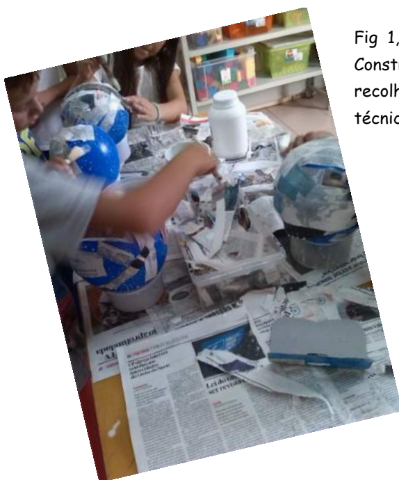
Fig 1, 2, e 3 - Halloween- Construção de cestos para recolha de doces, com a técnica do balão.