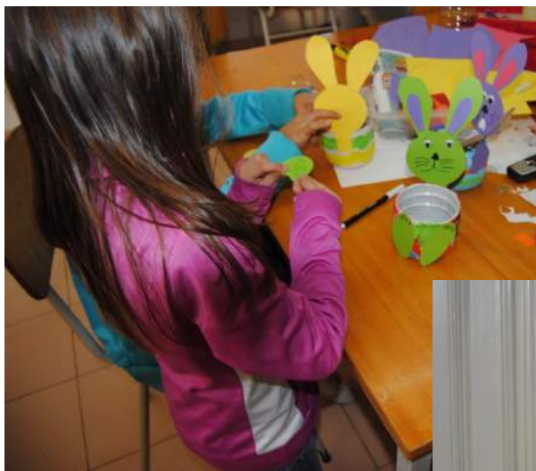
Fig 15 e 16 - Páscoa - Cesto em pasta de moldar, com garrafas de plástico.