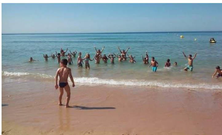
Fig 33,34,35 e 36 - Época Balnear