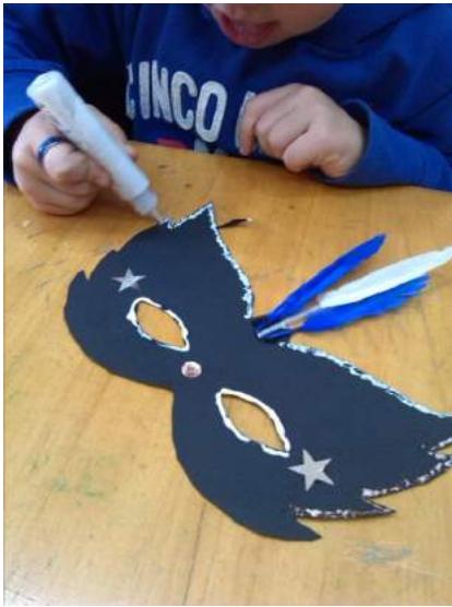
Fig 10 e 11 - Carnaval - Máscaras em cartolina decoradas com brilhantes e penas.