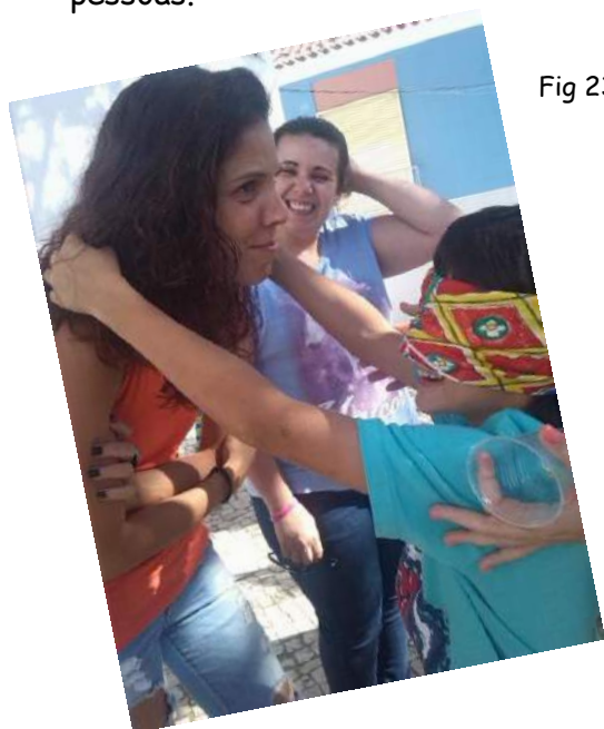
Fig 23 e 24 - Dia da Família

Estiveram presentes na festa 43 crianças e 49 familiares, num total de 92 pessoas.