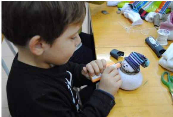
Fig 6 e 7 - Natal: Bonecos de neve com meias e areia.