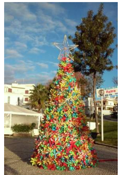
Fig 27,28,29, 30 e 31 - Criar Natal 2014