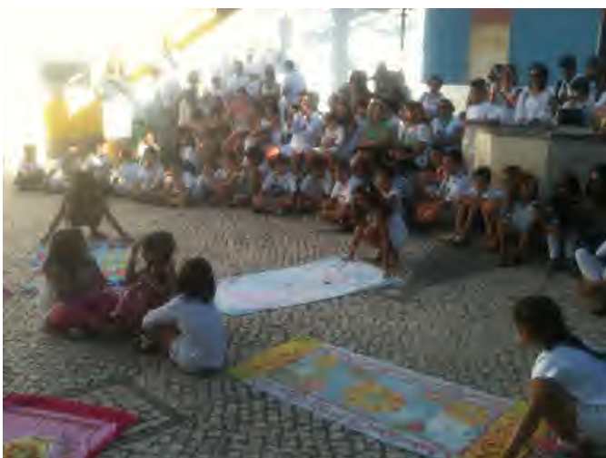
Fig 27 e 28 - Dia da Família

O segundo momento de festejo foi no final da Época Balnear com a FESTA DE ENCERRAMENTO . Estiveram presentes 34 crianças da Ludoteca e 79 familiares, num total de 113 convidados. As crianças apresentaram um espetáculo com as canções e danças ensaiadas durante a Época Balnear (tarde) e em seguida houve um jantar convívio com comida trazida pelas Famílias.