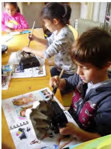
Fig 10 e 11 - Natal - Construção de um presépio com caixas de ovos, ráfia, feltro e tecido