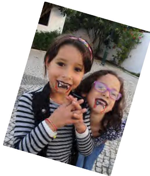
Fig 6 - Halloween Pinturas faciais