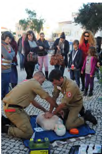
Fig 37, 38, 39 e 40