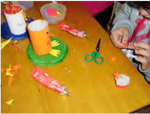
Fig 18 e 19 - Páscoa - Construção de uma galinha em rolos de papel higiênico, para encher com algumas amêndoas - oferta da Ludoteca às crianças