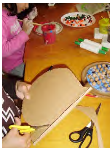
Fig 16 e 17 - Dia do Pai - Construção de um jogo "O Solitário" em massa branca, fimo e cartão.