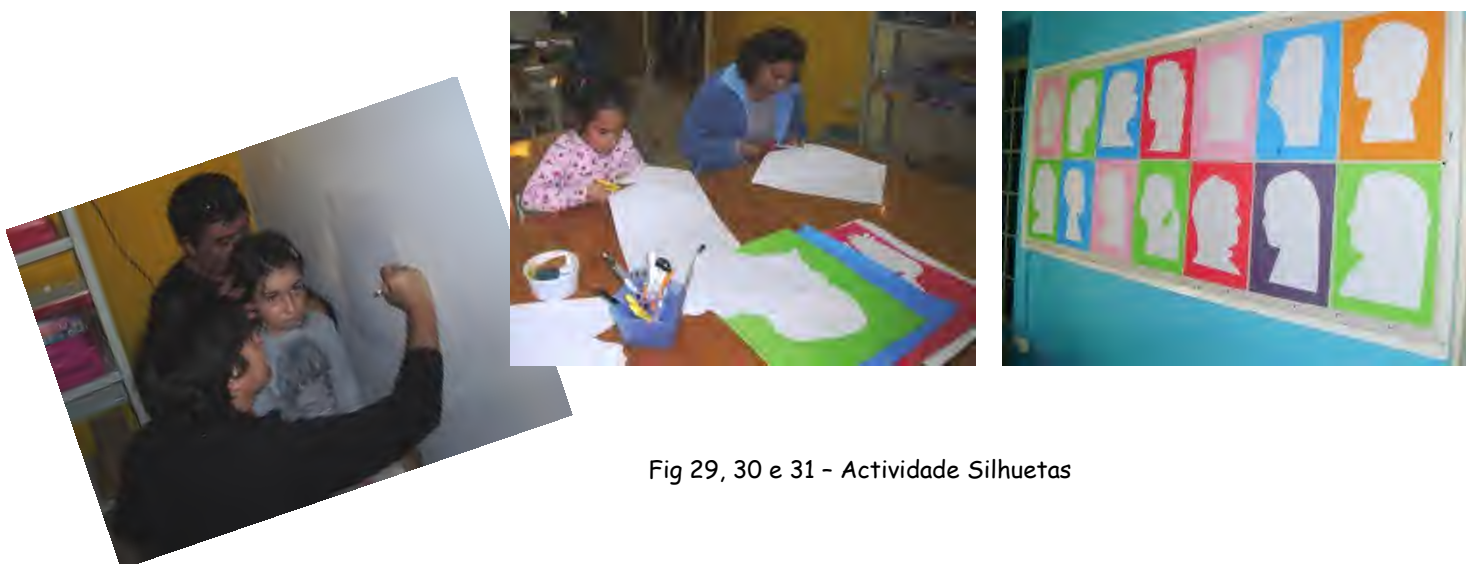
Fig 29, 30 e 31 - Actividade Silhuetas