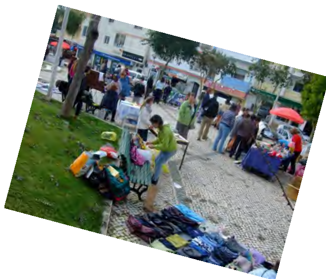
IV e V Feiras Colaborativas