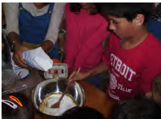
Fig 7, 8 e 9 - Magusto - Confecção de biscoitos de castanha