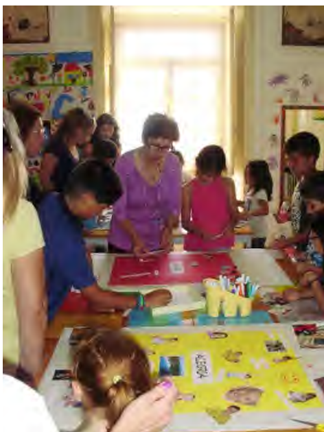
Fig 25 e 26 - Dia da Família