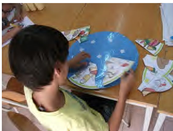
Fig 1 - Dia da Alimentação- Jogo sobre a roda dos alimentos