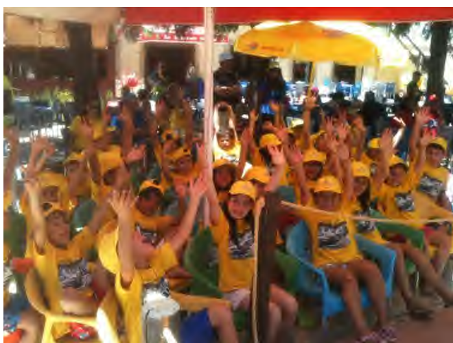
Fig 41, 42, 43, 44 e 45 - Época balnear

Durante a ÉPOCA BALNEAR o serviço da Ludoteca dividia-se em dois momentos distintos . No período da manhã (9.00h-14.00h) a equipa acompanhava um grupo de 30 crianças (constituído por inscrições sujeitas a critérios de prioridade para admissão) à praia e ao almoço. No período da tarde (14.00h- 17.00h) abria o espaço Ludoteca para todas as crianças que pretendessem frequentar sem número limite de inscrições.