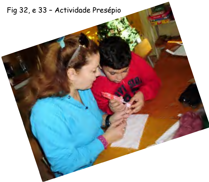
Fig 32, e 33 - Actividade Presépio