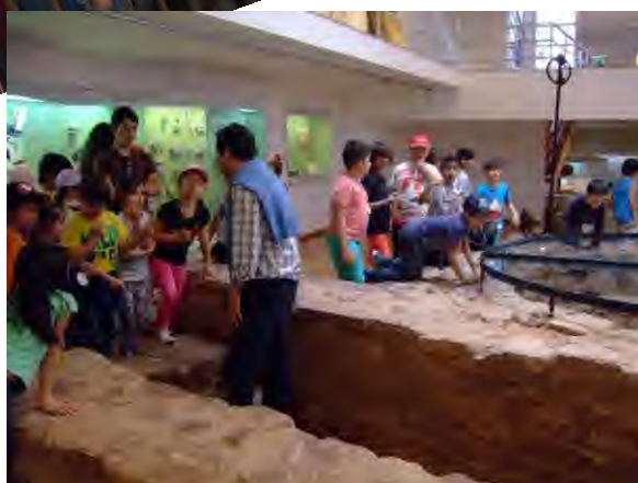
Fig 46, 47, 48, 49, 50 e 51 - Exploração do tema anual.